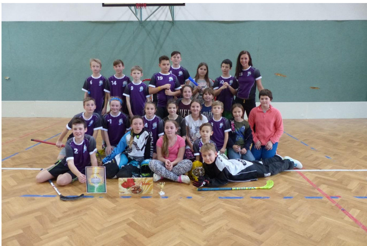
Vítězné Vánočního turnaje ve florbale.